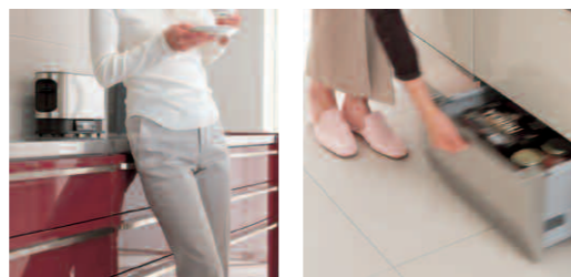
2秒以上押されたときは反応しないので、もたれかかってもOK。