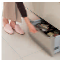
「フロアコンテナ」/足のつま先や掃除機が当たる足元はあえて搭載せず、軽い力で引けるつくり。