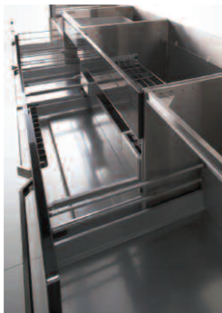
「18-8ステンレス」/クロムを18%、ニッケルを8%含み、ほとんど錆びることがない。とくにステンレスキャビネットは有害物質を排除した独自の工法でつくられ、環境や身体にやさしい。