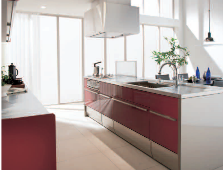
「S.S.サーボ」が搭載されたシステムキッチン「S.S.」。

手を使わずにワンアクションで簡単に引き出しが開けられる。日本初の新機能「S.S.サーボ」の使い勝手について教えてください。