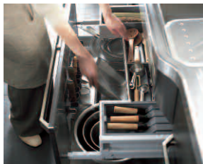
「ツールコンテナ」/シンク下をフル活用した収納庫。まな板・ふきん用のラック、ラップ・包丁・小物に便利なツールボックス、ざる・ボール類をたっぷりしまえる引き出しとレードルホルダーがついた3層構造で使いやすい。

「S.S.」の確かな機能とデザインを支えるのは、抜群の耐久性や耐熱性をもつ「18-8ステンレス」。鍋やカトラリーに使われる安心素材であり、長寿命で環境への負荷を抑えるエコマテリアルであるこの素材を、キャビネットの内側まで使うキッチンはほかにありません。シンクキャビネットに調理道具をまとめて収納する「ツールコンテナ」は、本物志向の「S.S.」のユーザーの声を取り入れて開発された、究極の道具箱。「S.S.サーボ」によって、その使いやすさは大きくグレードアップし、より豊かなキッチンシーンが描き出されることでしょう。