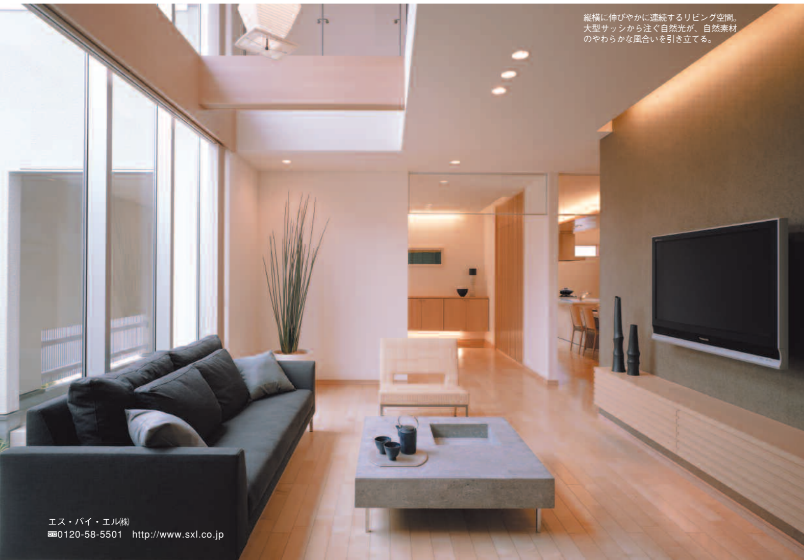
縦横に伸びやかに連続するリビング空間。大型サッシから注ぐ自然光が、自然素材のやわらかな風合いを引き立てる。

暮らし継がれる満足 時代に揃うが、高いデザイン性 外観は、シンプルでモダンなデザインを基調に、木や格子、切妻屋根などを取り入れて、未来に伝えたい和の感性をさりげなく表現。時代に左右されない品格と美しさがあります。木やタイルは時の流れのなかで味わいを深めていく素材。趣を増す美しさとともに、「そこに暮らす満足」は、次の、またその次の世代へと暮らし継がれていくでしょう。 暮らし継がれる心地よさ ライフスタイルに応じて変化する空間 床に落ちる日差しに心地よさを感じる心は、いつの時代も変わらないもの。「光風」と「MOO」は、大型サッシを採用し、さらに吹き抜けのあるオープンレイアウトで空間をゆるやかに結び、隅々まで明るさに満たした住まいを実現しています。 また、世代や家族構成が変化しても、つねにフィットする住まいであるように、間取りを変えることができます。間仕切り壁や収納家具で、ライフスタイルに合う空間に。図面にも、取り外せる壁がひと目で把握できるように表記してあるので、将来計画が立てやすいことは大きなメリットになります。 暮らし継がれる安心 強靱な構造とサポートシステム 「光風」と「MOO」は、高強度・高精度の木質接着パネルが作りあげる「木質パネル一体構法」。阪神淡路大震災レベルの揺れにも強い、耐震性の高い住まいです。 また、超・長期保証制度「住まいの生涯サポートシステム」を導入。緊急時の迅速な対応はもちろん、10年目までメンテナンススタッフが定期的にチェック。10年目以降も、有償メンテナンスを受ければ構造躯体に対する保証が更新されます。 住まいがある限り続く、エス・バイ・エルのお付き合い。ホームドクターがいるような安心も、次世代へと受け継がれます。