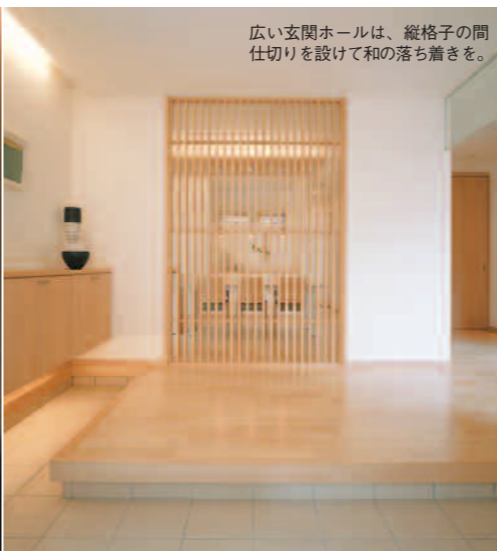
広い玄関ホールは、縦格子の間仕切りを設けて和の落ち着きを。