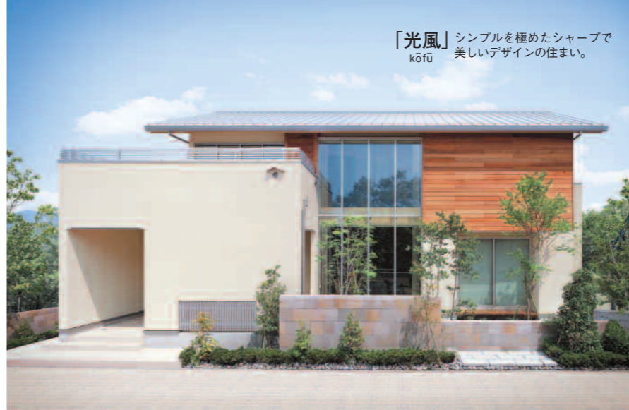
「光風」 シンプルを極めたシャープで美しいデザインの住まい。

永く住み続けるという住まいの絶対価値を、耐久性、デザイン性、可変性から追求して生み出されたエス・バイ・エルの「光風」と「MOO」。20年、30年といわれる日本の住宅サイクルを見直し、良質な住まいに永く暮らすことを促進する国の「長期優良住宅」の取り組みにもかなう、本物の価値がある住まいです。