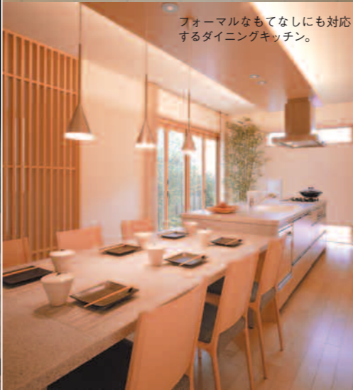
フォーマルなもてなしにも対応するダイニングキッチン。