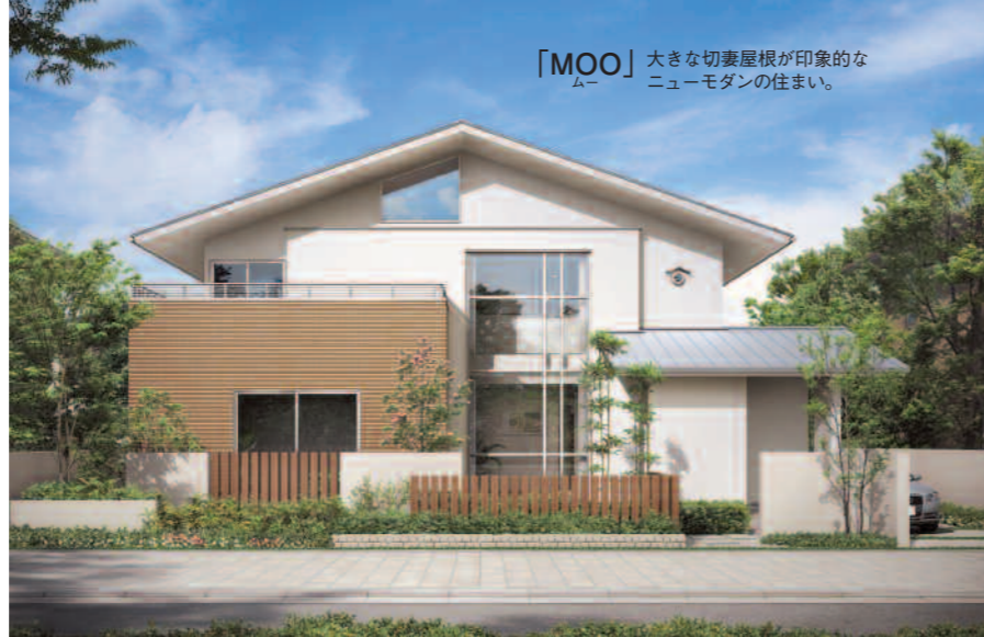
「MOO」 大きな切妻屋根が印象的なニューモダンの住まい。

延床面積141.79㎡ (42.89坪) 1階/77.22㎡ 2階/64.57㎡