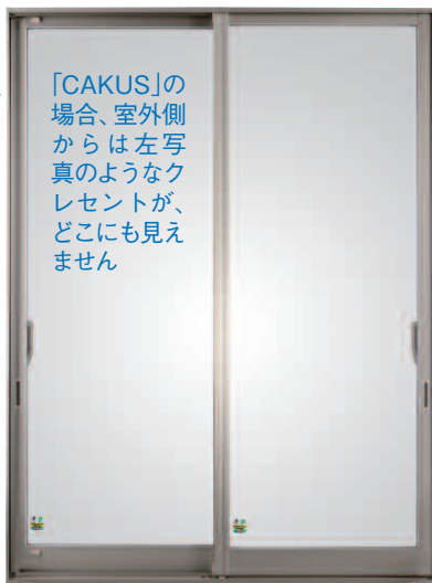
対応するサッシ「セーフ」

強防犯サッシ「セーフ」は、さらに「戸先錠」と「サブロック」と合わせて3ロックというガードの堅さ。防犯合わせ複数ガラスにより、セキュリティレベルはさらにアップします。また、すっきりとしたフォルムは、風景を絵のように切り取って見せることができるデザインです。