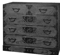
(上) 「部屋筆筒」 W166×D45×H100cm ¥4,357,500 (左) 「三尺筆筒」 W90×H75×D45cm ¥278,250