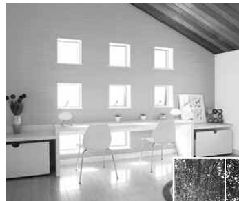
「シンプルアートⅡ」 FIX窓 ¥21,000～ 突き出し窓 ¥35,700～ (取付費・運搬費別)

●お問い合わせ先 トステム㈱ お客様相談室 ☎0120-126-001 http://www.tostem.co.jp/