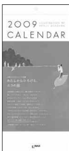
「わたしからひろげる、エコの話(わ)」 サイズ/縦37cm×横17cm