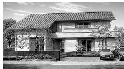
「イズオーダーJ」中心価格3,250万円 (本体価格のみ)