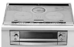
「ビルトイン型 IHクッキングヒーター」 CS-G38VNEWS ¥320,250 (工事費別)