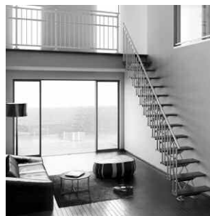
「レジェ・直線階段(竜骨タイプ)」 ¥711,270(組み立て・運搬・取付工事費別)

リビングの吹き抜けなどに設置する階段として人気の高い、新日軽㈱のアルミ室内階段「ビュライ レジェ」と「ビュライ フィス」。このたび、新型4種が追加されました。