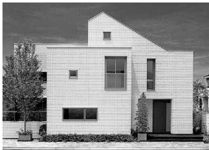
「ファインヘーベルハウス」3.3㎡当たり72万円～