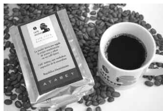
「アタベイ ドミニカンプレミアムコーヒー」 シティロースト・中挽 200g ¥1,260 (TYクリエイションアタベイコーヒー事業部) http://www.atabay.jp

●巻末の綴じ込みハガキがファックス送信票で資料を請求された方のうち、10名様にプレゼントします。