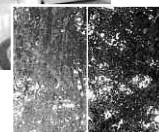
(左) 通常のガラス (右) 「アクアコート仕様」のガラス