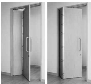
「カイクエン(介・楽・援)」 (右) ドアを押し開けた状態。 (左) ドアを引いて開けた状態。

●お問い合わせ先 三和シャッター工業㈱ お客様相談センター ☎03-3346-3011 http://www.sanwa-ss.co.jp/