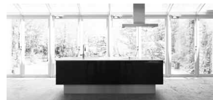
「パナソニックキッチン Living Station」 (Lクラス参考プラン 価格) I型2550mmの場合 約731,000円～

●お問い合わせ先 松下電工お客様ご相談センター ☎0120-878-365 http://national.jp/sumai/kitchen/living-station/