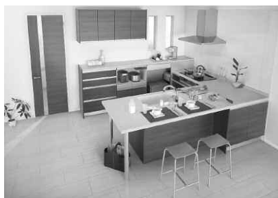
「クレディア」(トステム) 写真セット合計価格¥3,840,060 (施工費・運搬費等は別)

業界最多の対面式キッチンのプランを生み出してきた、トステム㈱のシステムキッチン「クレディア」が大幅リニューアルしました。