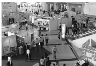
晴海トリトンスクエアの展示会場風景。

●期間/2008年10月8日(水)~12日(日) 11:00~19:00 (12日は17時まで) ●会場/晴海トリトンスクエア ●セミナー主催/晴海デザインセンター http://www.sumainavi.net/