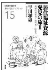
著者/早川和男 発行/東信堂 価格/700円

今回は、生活施設や寺院などが防災・復興資源として果たしている役割や、子供の犯罪被害防止に寄与している小学校・商店街の取り組み、「労働の場」が居住福祉資源として重要な役割を占めていることを紹介。日本の社会が直面する課題に注目し、自分たちの住む「まちや村や地域を福祉の目で見直す」ことを問いかけ、よりよい福祉空間のあり方を訴えています。